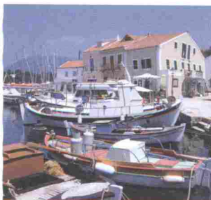
Port de Fiskardo, Céphalonie.