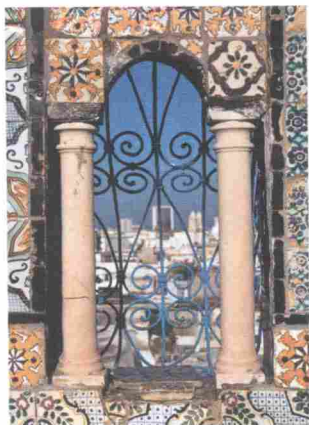
Dans la vieille ville de Tunis.